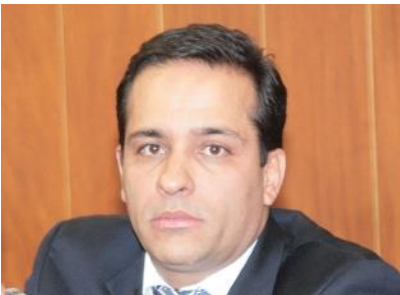
H. Senador Alexander López Maya