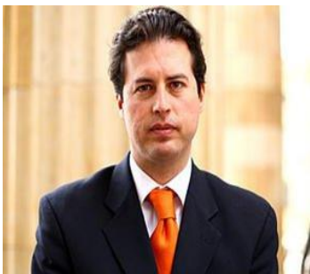
H. Senador Juan Manuel Galán Pachón