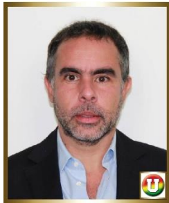
H. Senador Armando Alberto Benedetti Villaneda