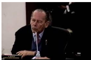
H. Senador Roberto Victor Gerlein Echeverría