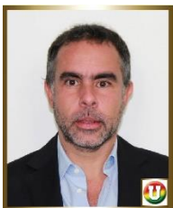
H.S. Armando Benedetti Villaneda Vicepresidente Partido de la U