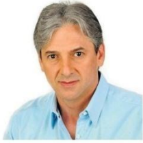
H. Senador Jaime Alejandro Amin Hernandez