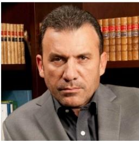
H. Senador Roy Leonardo Barreras Montealegre