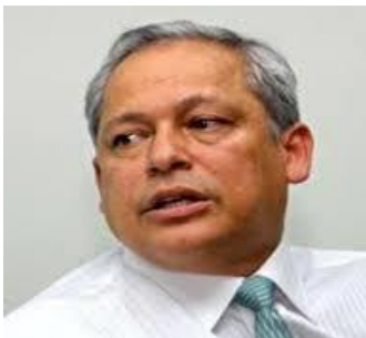
H. Senador Hernán Francisco Andrade Serrano