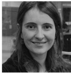
H. Senador Paloma Susana Valencia Laserna "En licencia de maternidad"