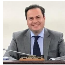
H. Senador Faruk Urrutia Jalilie Reemplaza a la H.S. Paloma Valencia