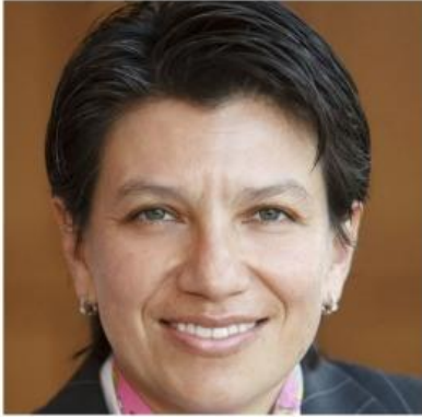
H. Senadora Claudia Nayibe Lopez Hernandez