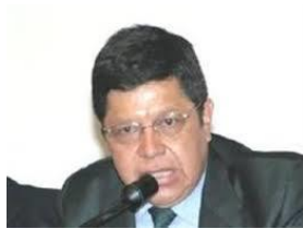
H. Senador Manuel Mesías Enríquez Rocero