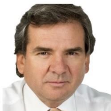
H. Senador German Varón Cotrino