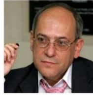
H. Senador José Obdulio Gaviria Velez